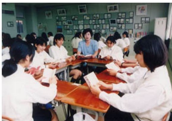
(ภาพบรรยากาศ กิจกรรมอ่าน 10 นาทีทุกเช้าของโรงเรียนแห่งหนึ่ง)

ที่น่าสนใจคือ จากรายงานการสำรวจวิจัยด้านการศึกษาของ OECD และผลการประเมิน ด้านการอ่านของ PISA (Program for International Student Assessment) เมื่อปี ค.ศ.๒๐๐๐ พบว่า นักเรียนญี่ปุ่นกว่า ๔๐% อ่านหนังสือเพื่อมุ่งเรียนหรือศึกษาต่อเป็นเป้าหมายหลัก แต่ไม่ได้ให้เวลากับ การอ่านหนังสือเพื่อความเพลิดเพลิน ผ่อนคลาย ผลสรุปจากการสำรวจนี้สะท้อนให้เห็นถึงปัญหาอีก รูปแบบหนึ่งของสังคมญี่ปุ่น องค์กรต่างๆตระหนักถึงความจำเป็นที่จะต้องดำเนินการส่งเสริมด้านการ อ่านของเด็กให้มากขึ้น ปีค.ศ.๒๐๐๒ รัฐบาลญี่ปุ่นจึงกำหนดกิจกรรม “อ่านทุกเช้า ๑๐ นาที” (朝の読書 Morning Reading) เพื่อให้โรงเรียนนำไปปฏิบัติ วิธีการคือนักเรียนและครูทุกคนจะร่วมมือกัน นำหนังสือที่ตนเองชอบอ่านมาโรงเรียนทุกวัน เพื่ออ่านเป็นเวลา ๑๐ นาทีในตอนเช้า(หนังสือซื้อมา หรือยืมจากห้องสมุด) วิธีส่งเสริมการอ่านด้วยกิจกรรมนี้แพร่หลายอย่างรวดเร็วในโรงเรียนทั่วประเทศญี่ปุ่นเนื่องจากทำได้ง่ายและเห็นผลทันที เมื่ออ่านหนังสือที่ตนเองชอบเป็นประจำและ ต่อเนื่องจะกลายเป็นนิสัยรักการอ่านได้ในที่สุด